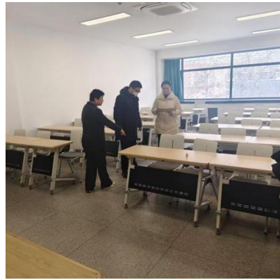
图5 检修北校区汉源楼