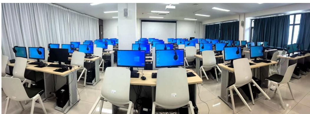
图10 检查并安装北校区104、106、108机房软件

4. 2月6日至9日为北校区104、106、108机房增加仿真软件NI Multisim软件、Python软件anaconda、ubuntu以及市场调研分析软件SPSS（如图10）。