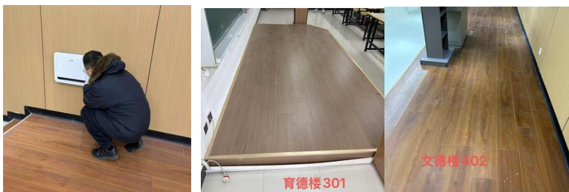
图2 检查屏蔽仪考场图