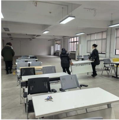
图4 布置明心楼南303教室