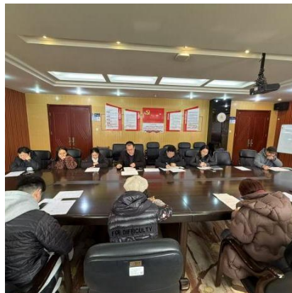
图9 开展2025年度考核工作情况

4. 2月6日至9日为北校区104、106、108机房增加仿真软件NI Multisim软件、Python软件anaconda、ubuntu以及市场调研分析软件SPSS（如图10）。