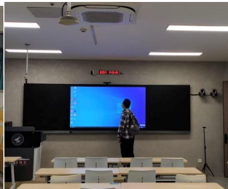
图3：维修北校区设备