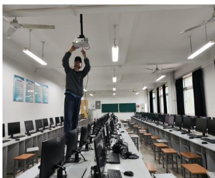
图3. 维修明理楼机房设备