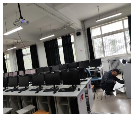
图4. 维修明理楼机房设备