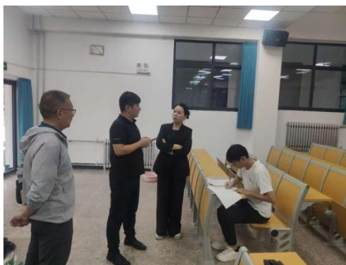
图2：验收建德楼设备

7. 维修北校区汉源楼教室部分故障设备给北校区3间机房安装上课软件。重新布置北校区的30间教室桌椅，做好开课准备。（附图3）