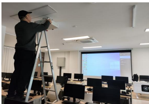
图4. 实验室设备故障维护工作情况图

2. 协助教培中心完成明理楼512机房120多台电脑重装系统，北校区部分机房故障维护工作，并安装教学软件，设备故障维护工作情况如图4所示；完成文德楼204机房系统崩溃修复工作，协助明德科技职业学院进行3间机房的设备维护的系统更新等工作。其更新系统工作情况如图5所示。