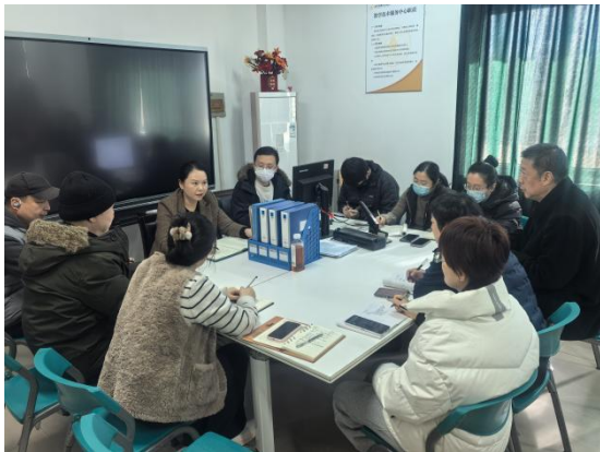
图2. 现场会议工作图

2. 及时现场维护教室设备在教学过程中出现的问题，如投影不能正常显示。经现场测试、维护后，教学正常进行。对教室大屏系统病毒查杀情况如图3所示。