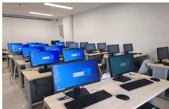
图5. 实验室更新系统工作情况图

3. 及时对24间公共机房进行的实验、实训教学提供日常现场维护工作，配合上课老师测试教学软件等。